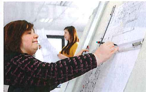
Dienstleistung ist immer nur so gut wie die Menschen, die dahinterstehen. Bei Schleifenbaum bekommen die Kunden das komplette Paket von der Planung bis hin zur Durchführung.

hat. So beispielsweise bei den Modeketten H&M und P&C. Für Tchibo legte sich das Unternehmen ebenso ins Zeug. In der Möbelbranche zeigte das Team sowohl bei Großflächenanbietern wie Brügge, Weko, Braun, Sommerlad, Brucker oder Turflon sein Know-how, genauso wie bei Unternehmen des klassischen Mittelstands, wie Hertel, Frey, Thiex, Berta oder Weber in Herxheim. Auch Filialisten wie Matratzen Concord wissen das umfangreiche Leistungspaket von