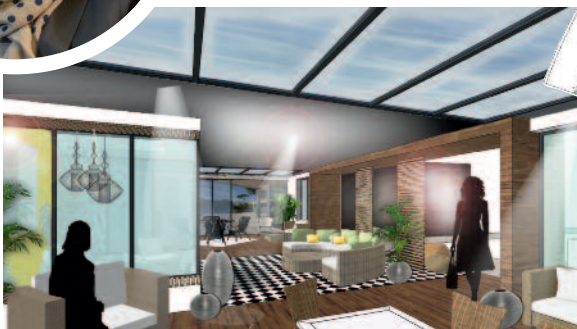
Im Showroom in Haiger kann für ein neues Konzept alles in Ruhe ausgesucht und besprochen werden. Dazu gehören auch Illustrationen bis hin zur 3D-Planung und Materialkollagen, die am Firmensitz erstellt werden.