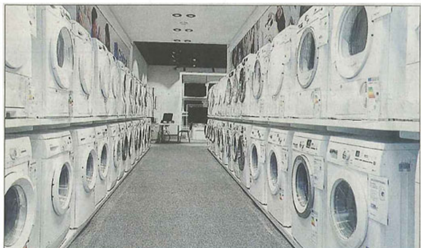
Eine riesige Auswahl an Waschmaschinen, Trocknern, Kühlschränken, Herd-Sets und Spülmaschinen stehen bereit.