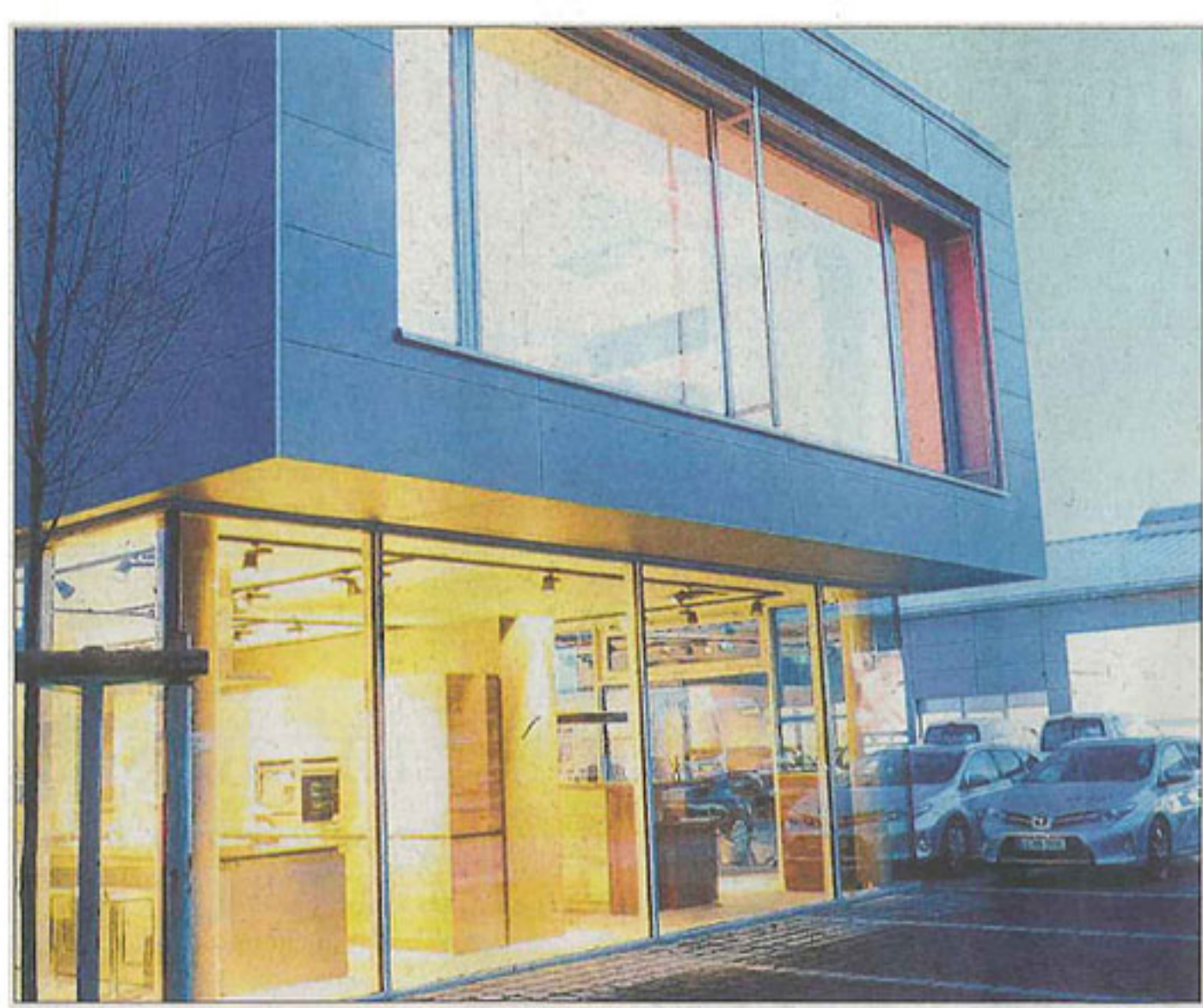
Das heimische Unternehmen Elektro Göttert eröffnete jetzt an der Bismarckstraße 95 a, Kunden können im Hof parken und gekaufte Produkte einladen.