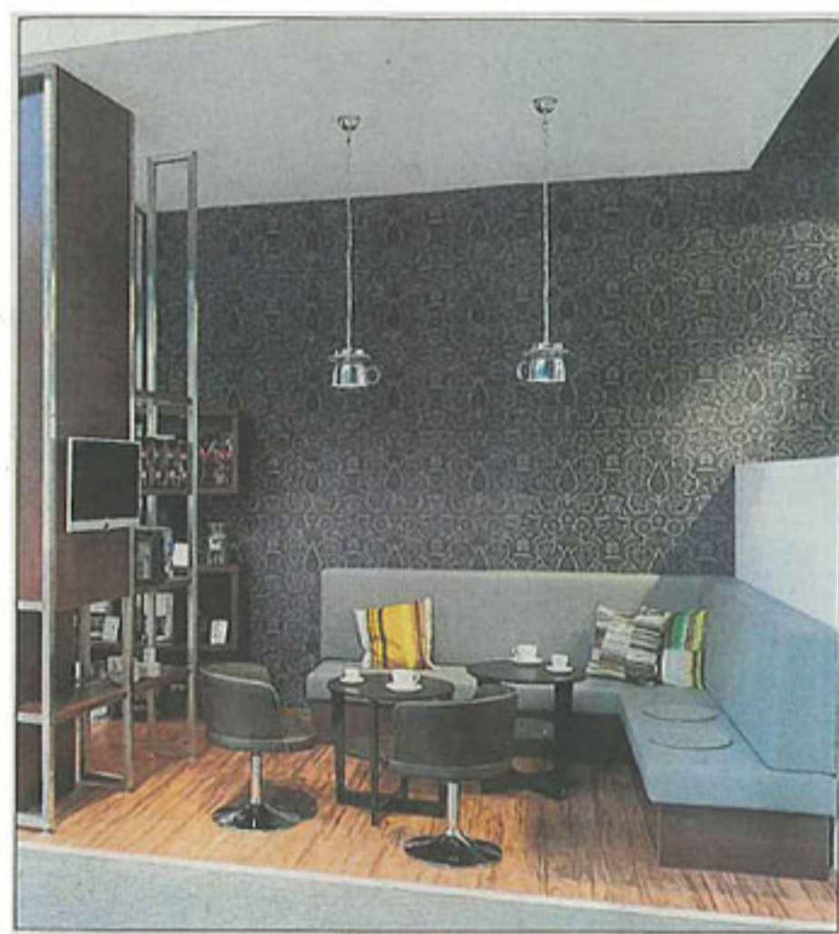
In der modernen Kaffeelounge werden Kaffeevollautomaten vorführbereit präsentiert.

Darüber hinaus setzt das Unternehmen auch weiterhin auf eine Premium-Beratung, einen Premium-Kundendienst und einen Premium-Lieferservice.