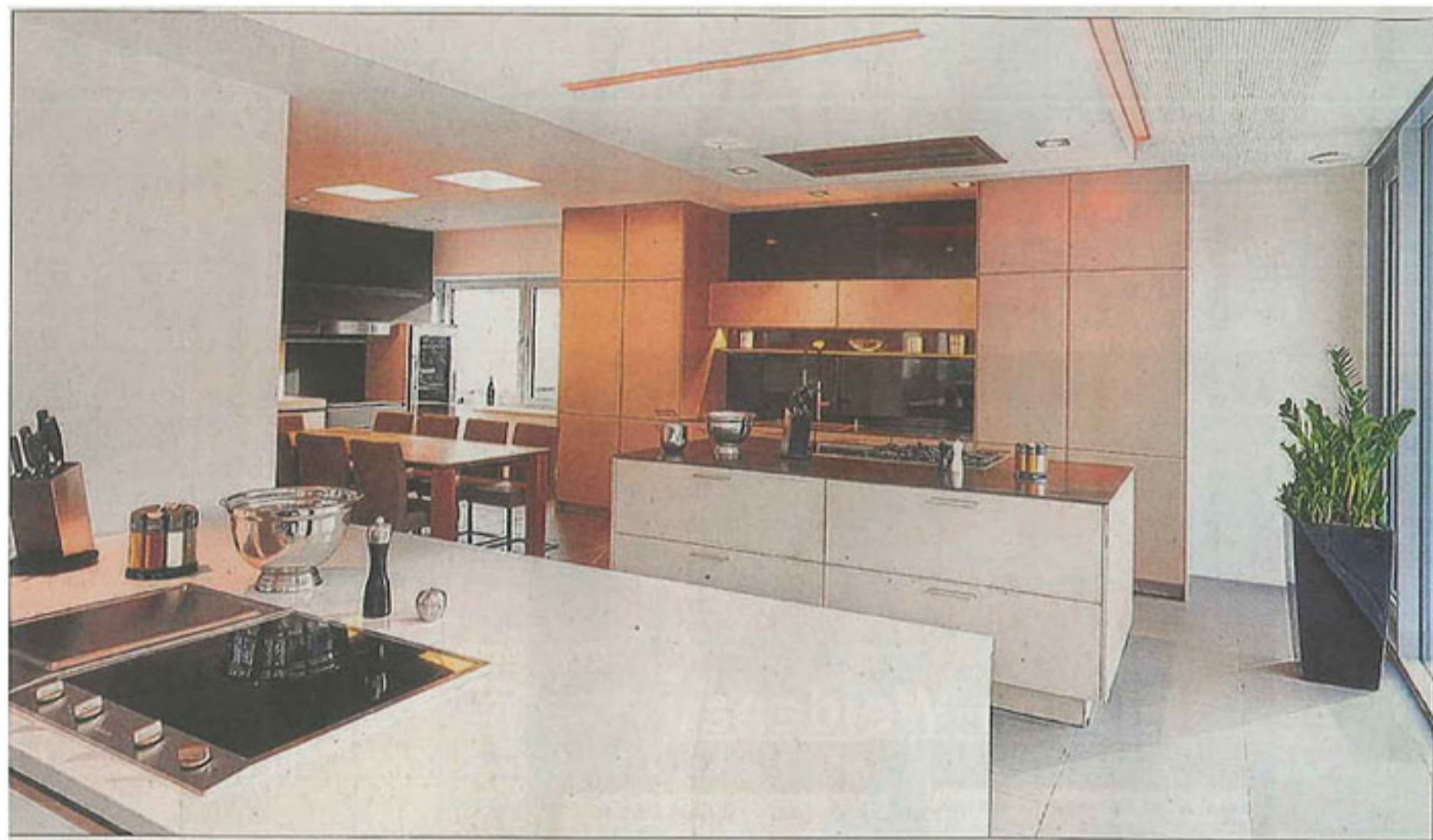
Ganz gleich ob in Rot, Holzbraun, Weiß oder welche Farbe auch immer: Die Küchenprofis von Elektro Göttert planen mit den Kunden ganz individuelle Küchen-Lösungen.