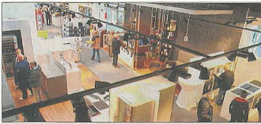
Hell, freundlich und in einem ganz modernen Ambiente: Beim Ladenbau wurde sehr auf Individualität und Moderne gesetzt.

In der Bismarckstraße bietet der Fachhändler ein frisches Konzept