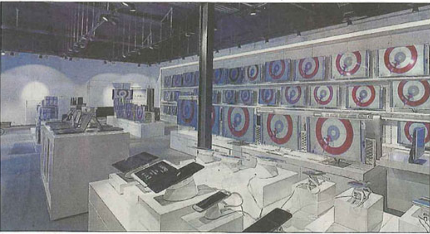
Modernste Technik beachtlich in Szene gesetzt: In den neuen Räumen von Elektro Göttert lockt das Einkaufserlebnis.